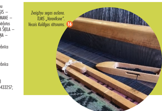
Zvaigzņu segas aušana. TLMS „Varavīksne”, Vecais Kuldīgas rātsnams.