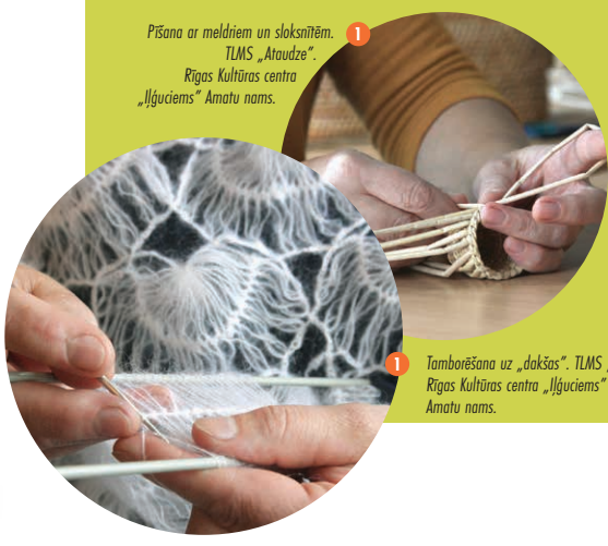
Pīšana ar mērdiem un sloksnītēm. TLMS „Ataudze”, Rīgas Kultūras centra „Ilģuciemis” Amatu nams.