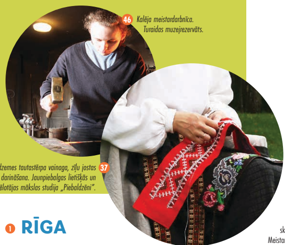
46 Kalēja meistardarbnīca. Turaidas muzejizvērt.