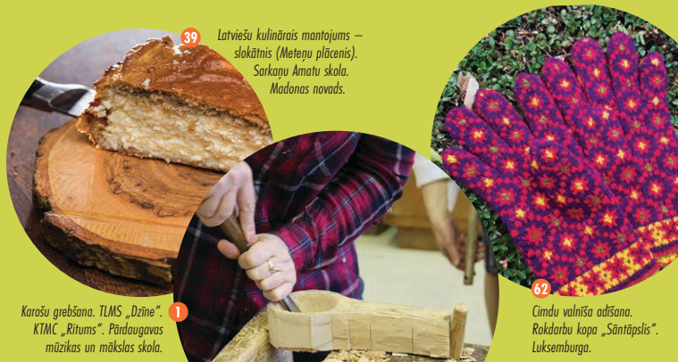
39 Latviešu kulīnārais mantojums – slokātnis (Metepu plācenis). Sarkaņu Amatu skola. Madonas novads.