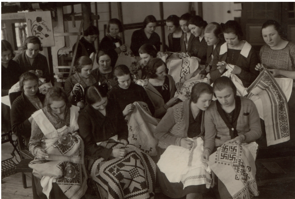
2. att. Izšūšana Kaucmindē 1928. g.