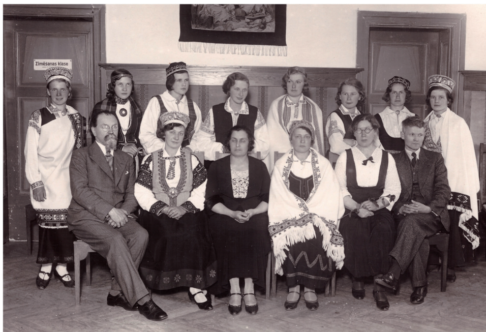
1. att. Latvju Sieviešu Nacionālās līgas 1933. g. aušanas kursu absolventes ar pedagogiem. Etnogrāfisko materiālu krātuve (E 26).

paaudzēm veidotu izpratni par tradīciju, lietderīgo un skaisto, Latvijā būtu vēlams atgriezties pie specializēto daiļamatniecības un mājturības skolu prakses. Tas ļautu atjaunot tradicionālo amatu pratēju un mācībspēku bāzi, kas dažāda līmeņa un profila mācību iestādēs un neformālās interešu grupās varētu mācīt tautas mākslas pamatus un tradicionālos amatus, kā arī saglabāt tautas vēsturisko atmiņu.