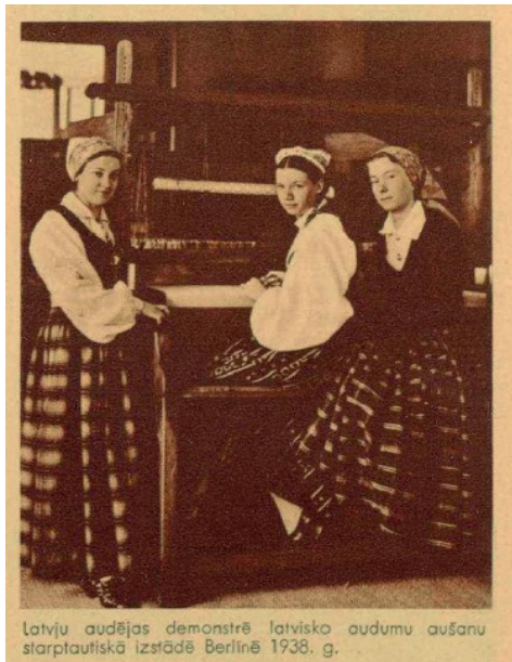
4. att. Latvju audējas demonstrē latvisko audumu aušanu starptautiskā izstādē Berlīnē 1938. gadā. Mūsu Mājas Viesis . Nr. 19. 1939. gads