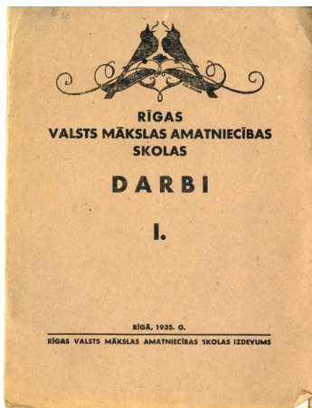
2. att. Rīgas Valsts mākslas amatniecības skola. Darbi I. Katalogs. Rīga, 1935.