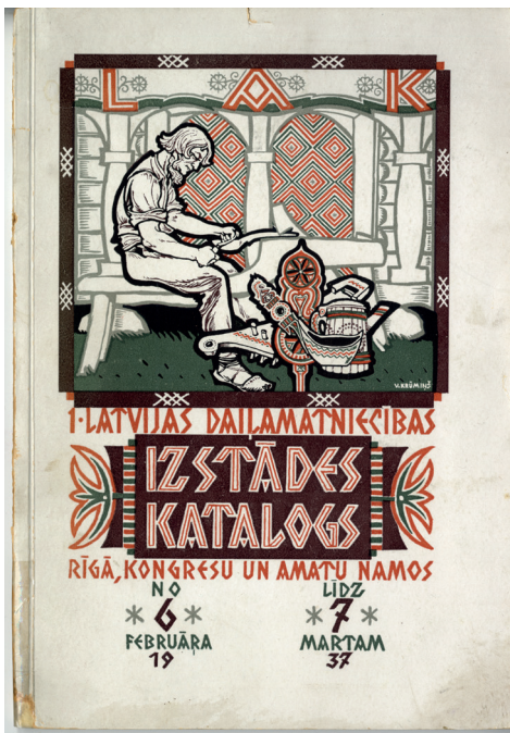
3. att. 1. Latvijas daiļamatniecības izstādes katalogs. Rīga, 1937