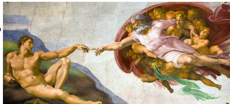
Vatikāna Siksta kapelas freska