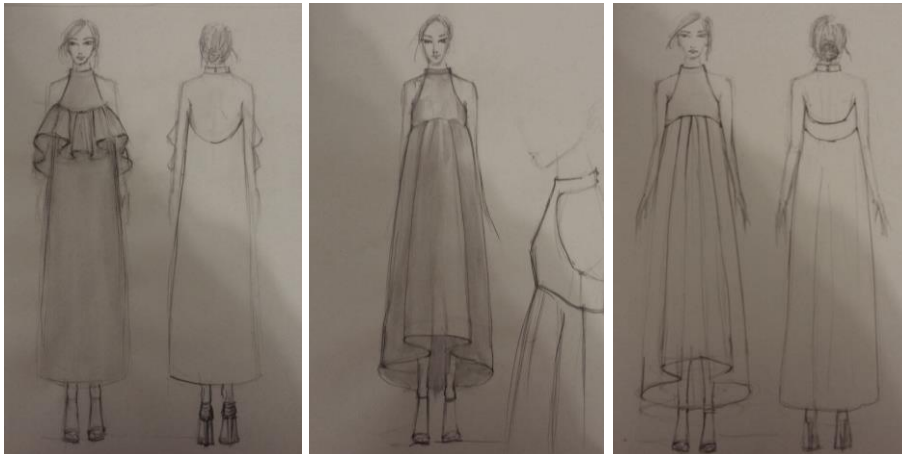
4.1.- 4.3.att. Kleitu modeļu skices