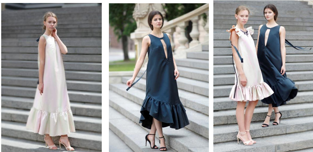
4.21.-23.att. Kolekcija “Izejamās kleitas”

Grims un frizūras, stils - Zita Ieva Visocka.