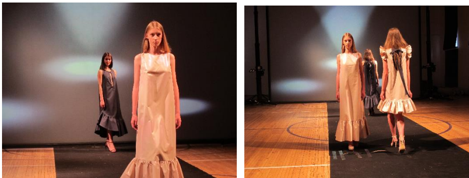
4.24.att. Mēģinājums; 4.25.att. Mēģinājums

Lai modes skate noritētu raiti un bez papildu satraukuma, kā arī maksimāli baudāmāks būtu izgājiens, iepriekš tiek organizēts mēģinājums (4.24.,4.25.att.). Tajā tika apskatīts koptēls, apvienotas autores idejas, horeogrāfes priekšlikumi un izveidota izgājienu horeogrāfija, kā arī sadarbībā ar modes skates scenogrāfu tika izveidots fona noformējums, lai radītu noskaņu tērpu izcelšanai. Un, visbeidzot, tika gūta pārliecība par muzikālā pavadījuma izvēles atbilstību.