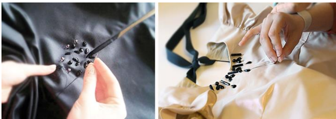
4.8.att. Priekšpuse; 4.9.att. Volāns; 4.10.,11.att. Izšūšana