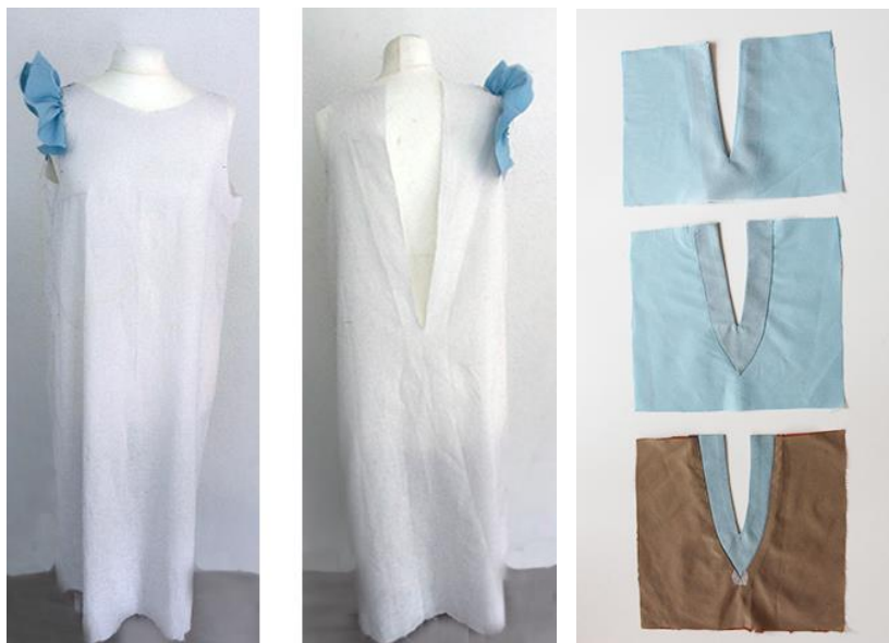
4.6.att. Kleitas makets, priekšpuse, mugurpuse

Tika izveidoti vairāki paraugi V-veida kakla izgriezuma apstrādei, lai atrastu labāko tehnoloģisko risinājumu. Kontrastējošā apdare ir arī dekoratīvs un grafisks dizaina elements, kas būtisks kleitas dizaina konceptā.