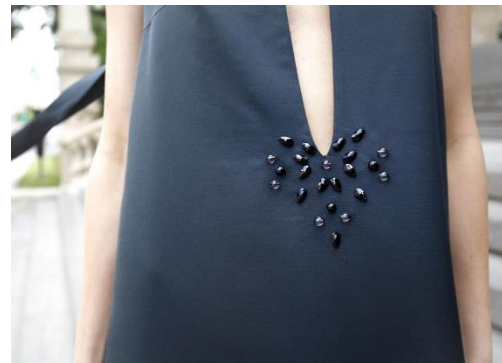
4.18.att. Kolekcijas “Izejamās kleitas” kopskats, priekšpuse. 4.19.att. Izšuvums