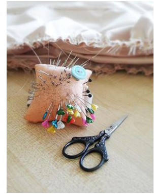
4.15.att. Izmantotais aprīkojums; 4.16.att. Tvaika gludeklis; 4.17.att. Adatu spilventiņš, mazās šķērites