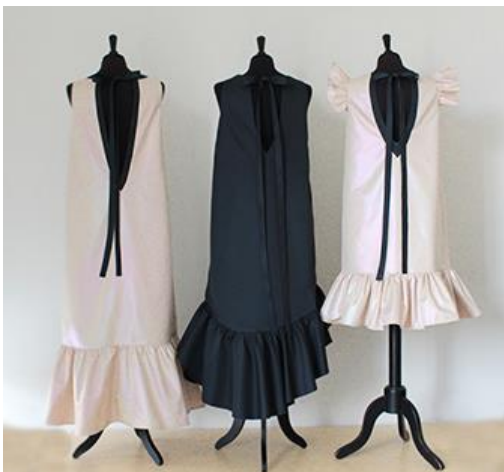
4.20. att. Kolekcijas “Izejamās kleitas” kopskats, mugurpuse.