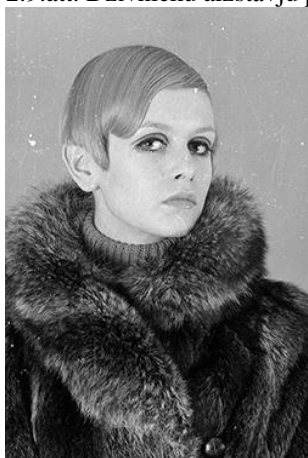
2.10.att. Modele Twiggy mākslīgās kažokādas mētelī