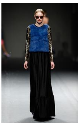
2.3.att. Stella McCartney rudens/ziema 2016