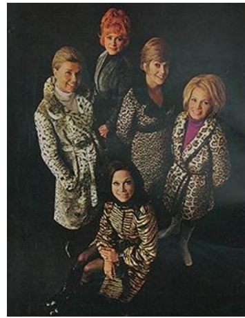
2.12.att. Shirley MacLaine filmā "What a way to go!" 1964