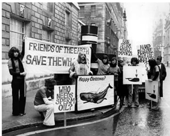
2.9.att. Dzīvnieku aizstāvju pikets