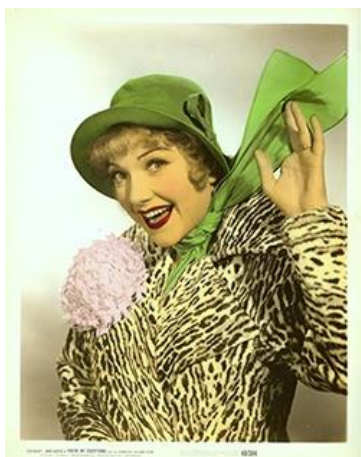
2.8.att. Anne Baxter filmā "You're my everything" 1949

Mūsdienās, jaunākās tehnoloģijas ļauj izveidot mākslīgo kažokādu, kas gan pēc izskata, gan taustes līdzinās dabīgajai. Tāpēc daudzi dizaineri uzskata dabīgo kažokādu izmantošanu par bezjēdzīgu.