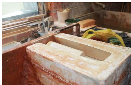
3.12., 3.13., 3.14.att. Ģipša masas jaukšana