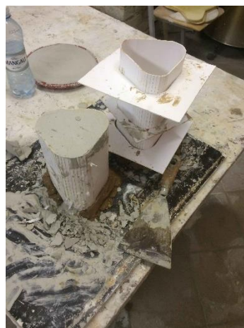
3.7., 3.8.att. Modeļa izliešana

Kad modeļi ir izlieti, tos noslīpē ar smilšpapīru, lai būtu gluds modelis un to uzreiz varētu atliet formā. Sākumā modeli iemūrēja mālos, tad saziepēja, lai, lejot ģipsi formai, tas nesalīptu ar modeli (3.9., 3.10., 3.11. att.). Tad sekoja ģipša sajaukšana un formas atliešana (3.12., 3.13., 3.14. att.). Darbība notika meistara uzraudzībā. (3.15., 3.16. att.) jau ražotnē Vaidava Ceramics .