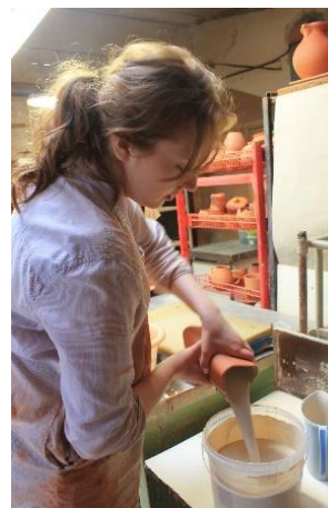
3.36., 3.37., 3.38. att. Trauku glazēšana

Vēlāk, kad trauki ir glazēti, tos vēlreiz no ārpuses apšvammē, lai pārlicinātos, ka glazūra nav ieēdusies mālā un dedzināšanas laikā neparādīsies glazūras pigmenti. (3.39., 3.40. att.)