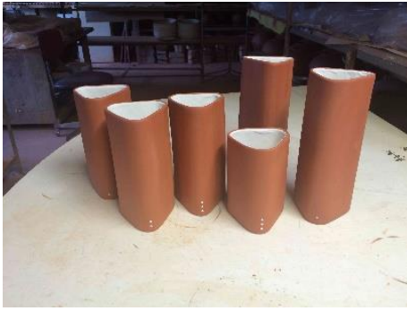
3.41. att. Punktiņu uzgleznošana