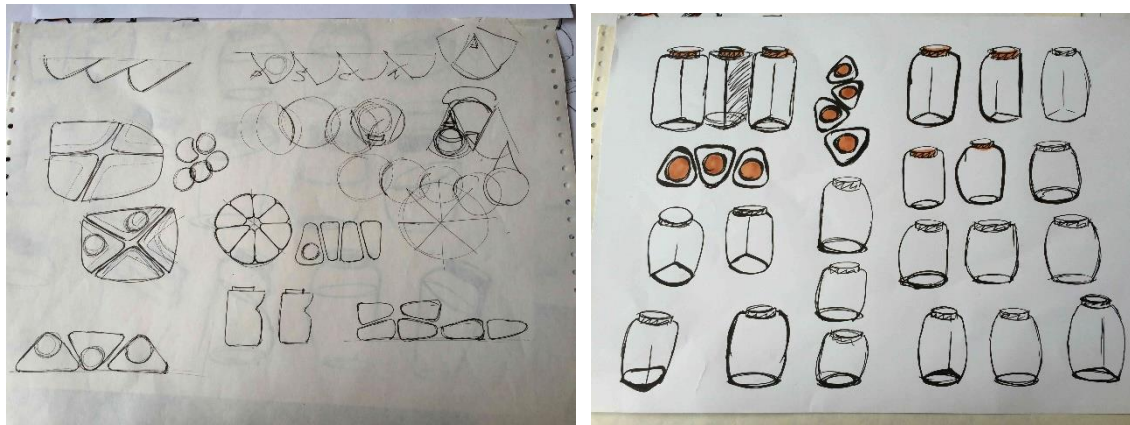
3.1., 3.2.att. Darba skices

Pirms objekta izveides nācās apskatīt analogus un izpētīt līdz šim atrisinātās problēmas trauku izgatavošanā, lai padarītu ikdienu ērtāku. Tam sekoja trauku skicēšana. (3.1., 3.2.att.)