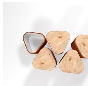
3.3., 3.4.att. Darba vizualizācija

Pēc vizualizācijas studente saprata, ka var veidot maketus M1:1, lai redzētu reālos izmērus un to, cik parocīgi ir šie trauki, un vai vēl nevajag ko mainīt izmēros. Veidojot maketus, radās izpratne par trauku tilpumiem, berot tajos attiecīga tilpuma produkciju (auzas, miltus, miežus, rīsus, pupas utt.). (3.5., 3.6.att.)