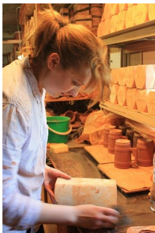
3.28. att. Trauka izņemšana no formas