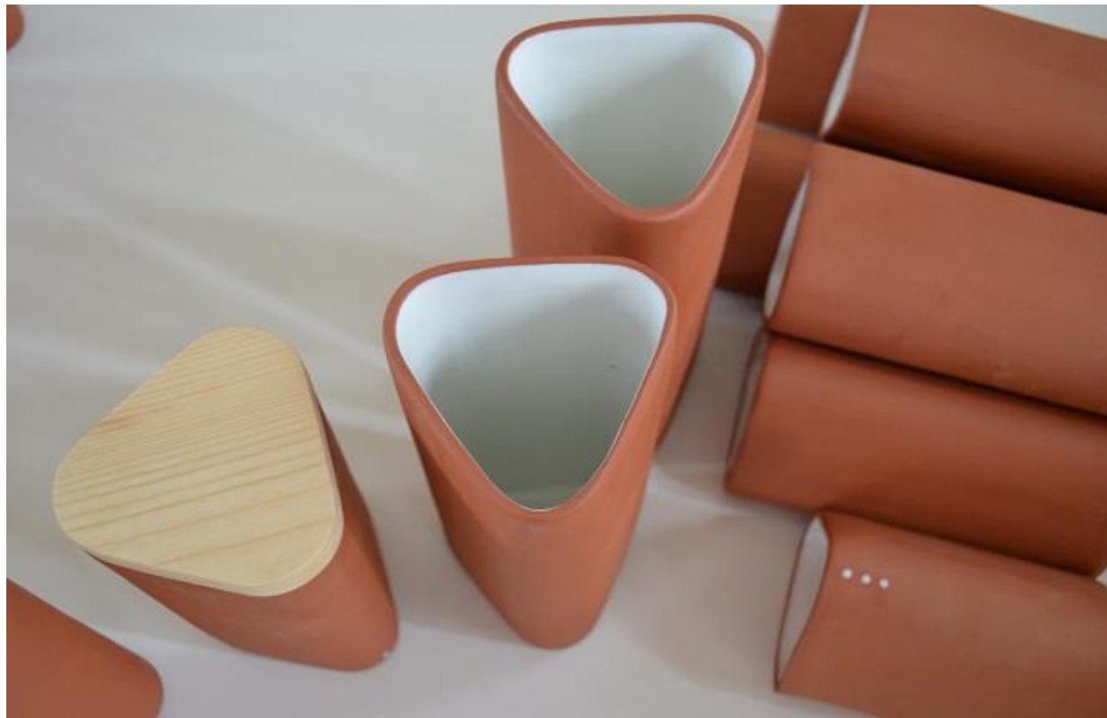
3.45.att. Gatavā trauku grupa