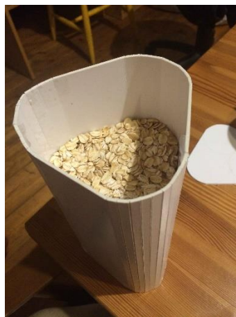
3.5., 3.6.att. Tilpuma noteikšana

Saprotot, ka paredzētajiem izmēriem un tilpumiem trauki atbilst, tika izgatavoti palielināti maketi, lai no ģipša varētu izliet modeli. (3.7., 3.8.att.)