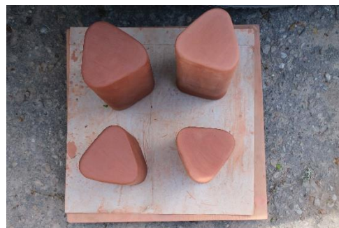
3.29. att. Trauki turpina žūt

Kad tie ir izžuvuši, tos apstrādā ar smilšpapīru, lai trauks būtu tikpat gluds kā Vaidava Ceramics trauku komplekts "Zeme". Vispirms noslīpē trauka augšējo pusi uz lielā smilšpapīra dēļa, lai augša būtu taisna. Pēc tam tika slīpēta trauka iekšpuse, bet pēcāk ārpusē. (3.30., 3.31., 3.32. att.)