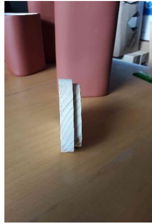
3.42., 3.43. att. Vāku realizācija