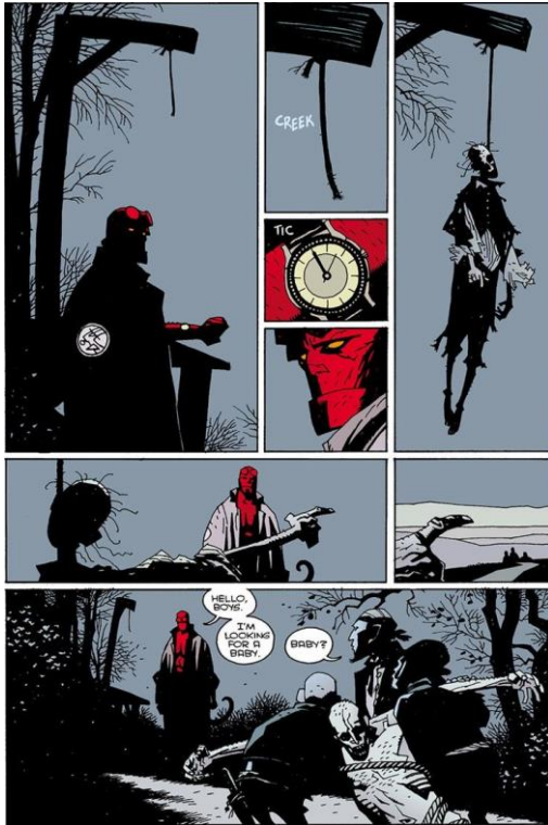
2.2. att. Mike Mignola Hellboy: The Corpse

Kā vēl viens no paraugiem, ko pētīju, bija ilustratora Bernija Vraitsona (Bernie Wrightson) darbi – specifiski viņa gotiskās ilustrācijas Mērijas Šelijas (Mary Shelley) Frankenšteina adaptācijai (2.3. att.).