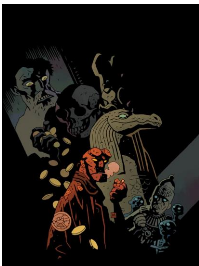
2.1. att. Mike Mignola Hellboy